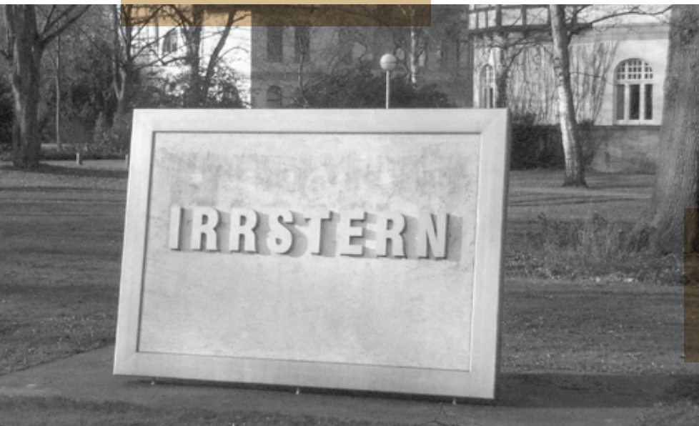
Mahnmal IRRSTERN im Park des Klinikums Bremen Ost, 2000