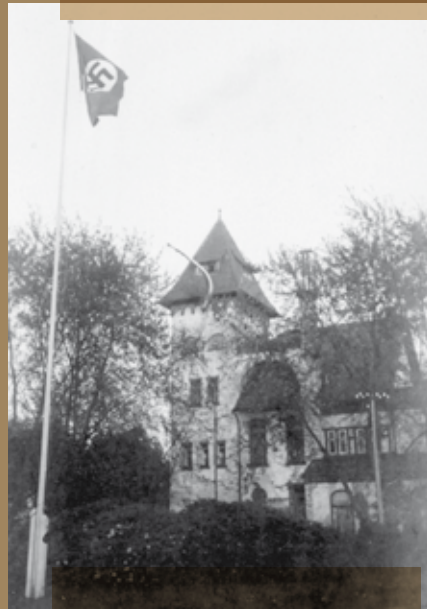
Verwaltungsgebäude der Bremer Nervenklinik, um 1933

Zeitzeugen und Zeitzeuginnen erzählen aus ihrer Kindheit und Jugend im Nationalsozialismus. Angehörige – Erwachsene, Jugendliche, Kinder – ihrer Familien sind Opfer von Medizinverbrechen geworden. Jahrelang fehlte ihnen die Gewissheit, was in der Zeit des Nationalsozialismus wirklich mit den Eltern, Geschwistern, Tanten und Onkeln passiert ist. Denn die Wahrheit über die Verbrechen – wie dem Mord an Behinderten und Psychatriepatienten und der Zwangssterilisation tausender Frauen und Männer – wurde nicht nur in Politik und Gesellschaft, sondern auch in den Familien selbst meist verschwiegen.