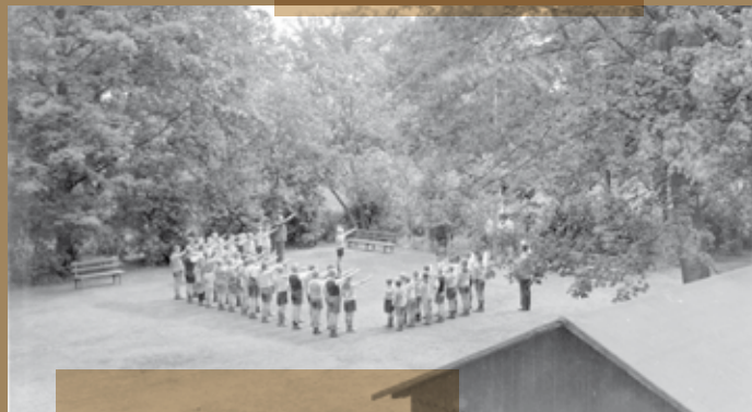
Flaggenparade im St. Petri Waisenhaus, um 1937