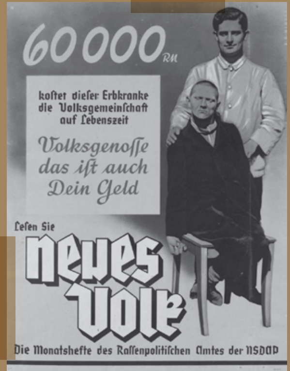
Propaganda gegen psychisch Kranke. Neues Volk, Die Monatshefte des Rassenpolitischen Amtes der NSDAP, um 1938